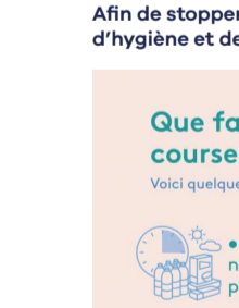
Gaëlle Le Bastard